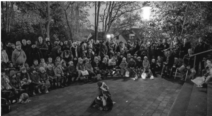
Aufführung auf dem Kirchvorplatz

www.nabu-remseck.de/naturschutzjugend-naju