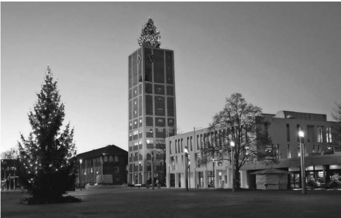
Der Kornwestheimer Weihnachtsmarkt findet in diesem Jahr zum ersten Mal auf dem Marktplatz statt.

INFO: Aufgrund der Aufbauarbeiten des Weihnachtsmarktes wird der Wochenmarkt am Freitag, 2. Dezember 2022, auf den Holzgrundplatz und in die Güterbahnhofstraße verlegt. Parkmöglichkeiten gibt es im City-Parkhaus und in den Tiefgaragen im E-Center sowie am Holzgrundplatz.