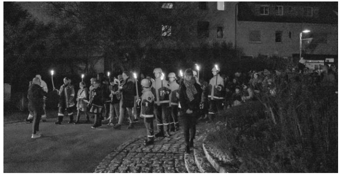
Umzug mit Fackelträger durch Aldingen