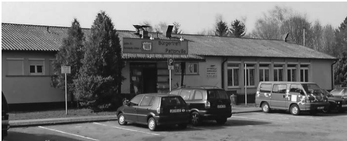
Hier wurde er gegründet