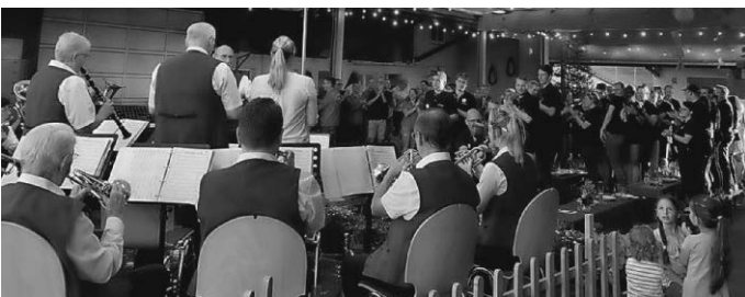
Die Besucher feiern stehend auf den Bänken