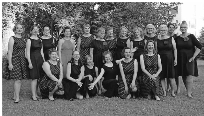
15 Jahre »Happy together«