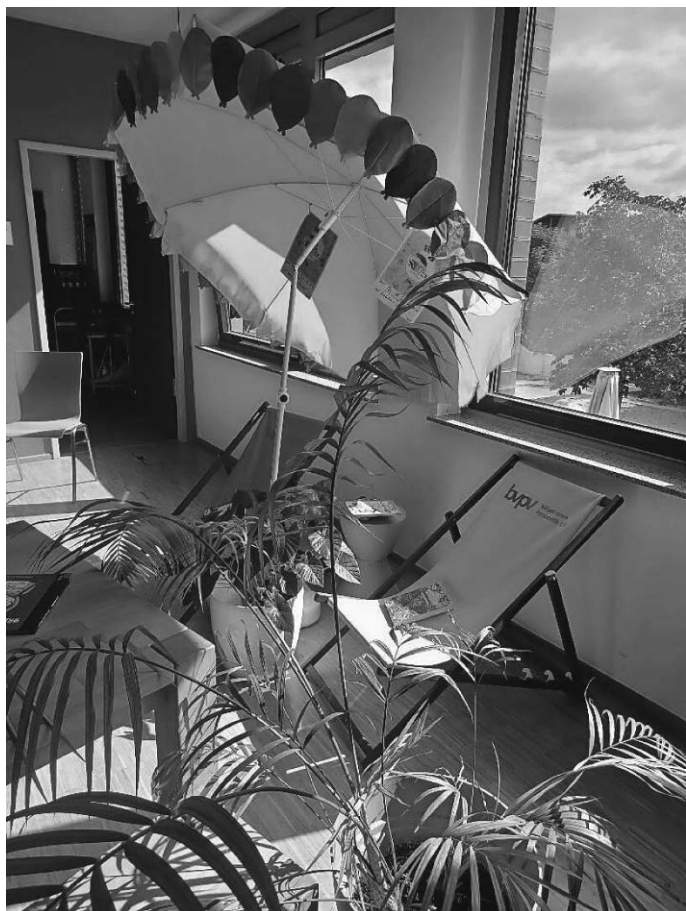
HAL verändert auch unsere Bücherei ein bissle...

Die Bücherei Pattonville ist auch auf Instagram zu finden: @buechereipattonville Wir werden in den Ferien vermehrt Lesetipps dort posten! Bis dann!