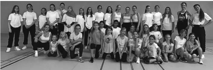
Endlich war es so weit: Auftritt der Tanz-Abteilung des SV Pattonville in der Sporthalle.