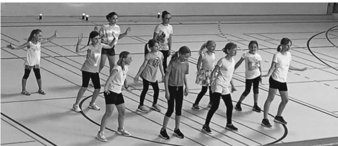
Happy Dancers: Die Gruppe der Sechs- bis Zwölfjährigen.