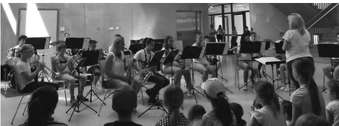
Jugendorchester beim Musikschultag