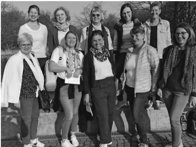
Die Ladies waren beim »Musizieren für den Frieden« in Kornwestheim mit dabei.

Zwar sind es keine 17. Jahre her, dass sich eine Gruppe von Ladies zum ersten Mal in Pattonville im Bürgerhaus getroffen haben, sondern 15. Jahre und blond sind auch nicht mehr alle, aber die 66. Jahren, bei denen das Leben erst anfangen soll, haben wir als A Cappella Ladies auch noch nicht auf dem Buckel. Vielmehr stehen wir alle voll im Leben und dazu müssen wir nicht erst 66. Jahre alt werden. Darum feierten die A Cappella Ladies am 16.3.2022 ihr 15. Jähriges Bestehungsjubiläum. Schön ist, dass einige der Gründungsmitglieder immer noch aktive mit dabei sind. Da im Vorfeld nicht klar war, welche Vorgaben für Veranstaltungen gelten werden, plante das Jubiläumsteam ein online Event, bei dem sich auch ehemalige Mitglieder dazu schalten konnten, so gab es auch Besuch aus Berlin.