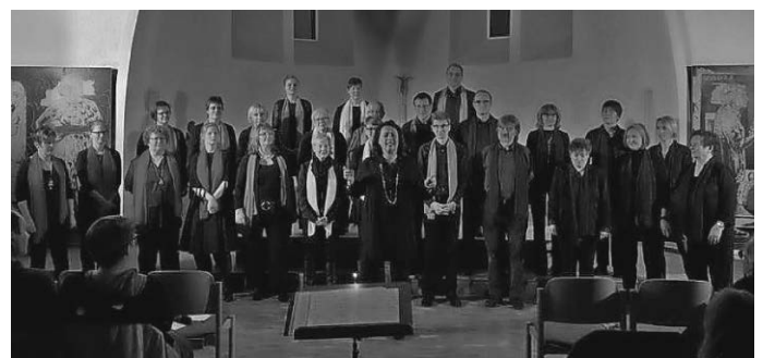
Gospelsingers bei einem Konzert 2017

Eine phantastische Gelegenheit bei uns einzusteigen! Hast Du Lust (wieder) zu singen, Freude zu haben in einer bunt gemisch-ten Gruppe, die 2 Generationen umspannt, und hast deinen Mon-tagabend noch nicht verplant? Dann bist Du ganz herzlich will-kommen. Schau einfach bei uns vorbei. Es gibt kein Vorsingen, jede(r) kann singen.