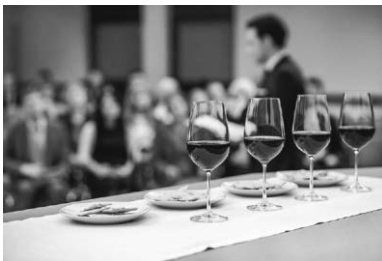
Gottesdienst am wichtigsten Feiertag von Jehovas Zeugen

Am Freitag, den 15. April 2022 gedenken Jehovas Zeugen auf der ganzen Welt des Todes Jesu. Jeder in der Region Pattonville ist eingeladen, an diesem besonderen Gottesdienst kostenlos teilzunehmen.