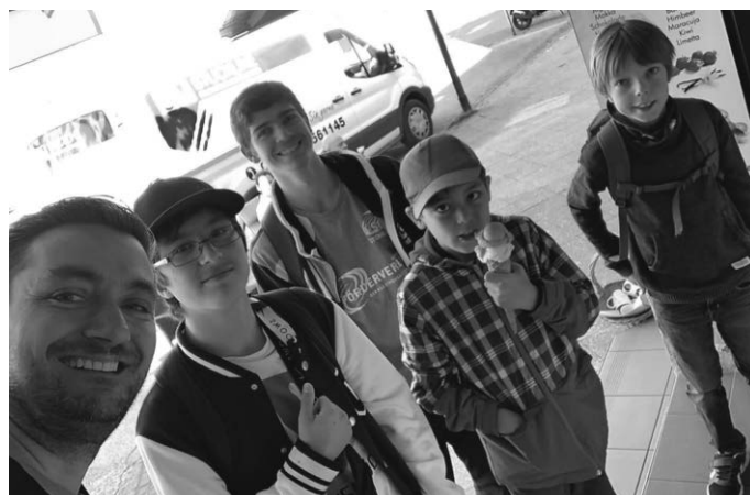
Die Jugendmannschaft der Schachfreunde Pattonville

Am Samstag spielte unsere erste Jugendmannschaft in Kornwestheim. Leider war von Kornwestheim nur drei Spieler anwesend. Somit sind wir bereits vor dem richtigen Spiel 1:0 in Führung gegangen.