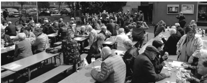
Mittagessen unter freiem Himmel