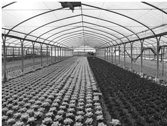
Die „Gläserne Produktion“ bietet spannende Einblicke in landwirtschaftliche Betriebe.