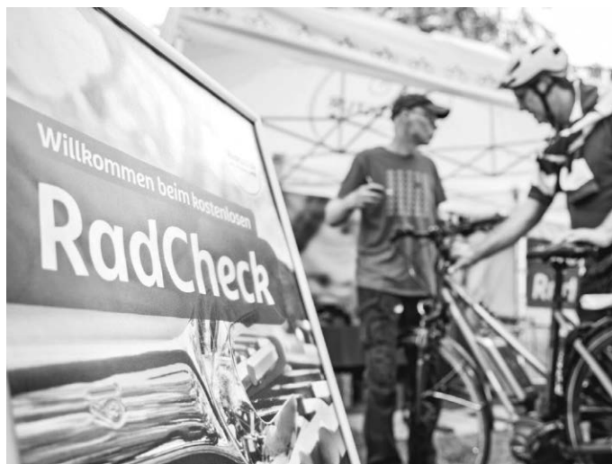
Beim RadCheck können Fahrradfahrende ihr Rad kostenlos prüfen lassen.

Zum RadCheck gelangen die Radfahrenden über den Eingang in der Hindenburgstraße 20 – dann der Beschilderung folgen. Eine vorherige Anmeldung ist nicht erforderlich. Der RadCheck ist eine Aktion im Rahmen der Landesinitiative RadKULTUR. Die Initiative will die Freude und Selbstverständlichkeit am alltäglichen Radfahren in Baden-Württemberg fördern und so dazu beitragen, das Mobilitätsverhalten zu verändern.