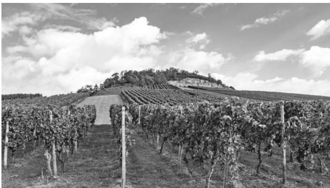
Die Felsengartentour führt von Hessigheim durch die Weinberge entlang des Neckarufers hinauf in die Felsengärten und bis zur mittelalterlichen Besigheimer Stadtkirche (Landratsamt Ludwigsburg).

Der Wein-Lese-Weg auf dem Württemberger Weinwanderweg erstreckt sich über insgesamt 35 Kilometer und führt an 15 literarischen Stationen vorbei. Die Route verläuft durch die Schillerstadt und das Bottwartal. Auf der Wanderung wird deutlich, welche berühmten Dichter und Denker sich in dieser Region wohlfühlten. Weitere Tipps zu den einzelnen Wanderrouten im Landkreis Ludwigsburg finden sich unter: www.landkreis-ludwigsburg.de/landratsamt-landkreis/tourismus-freizeit/aktiv-durch-den-landkreis/wandern/