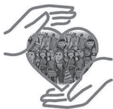
Förderverein der Grundschule Pattonville