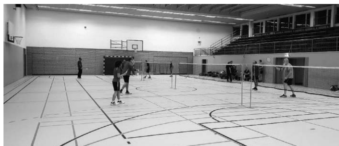
In der Sporthalle Nord stehen uns vier Plätze zur Verfügung.