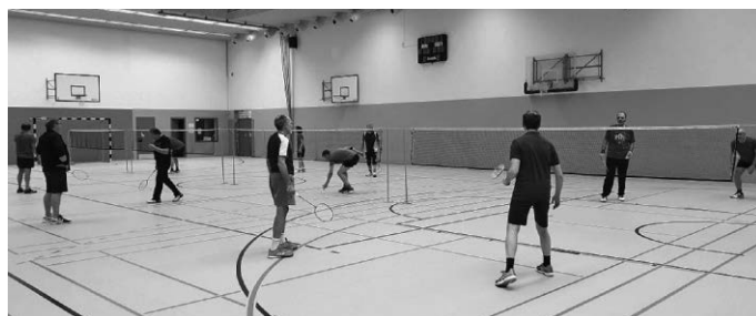
Meistens spielen wir Badminton im Doppel.