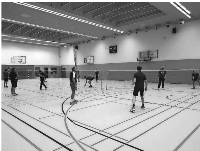
Die Freizeitsport-Gruppe Badminton beim Training.

Der SV Pattonville ist vielleicht nicht der größte, aber ein sehr aktiver Verein. Da sicher nicht jeder unser breites Angebot kennt, wollen wir den Leserinnen und Lesern einen Einblick geben und unsere Abteilungen beziehungsweise Kurse vorstellen. Heute: Freizeitsport/Badminton