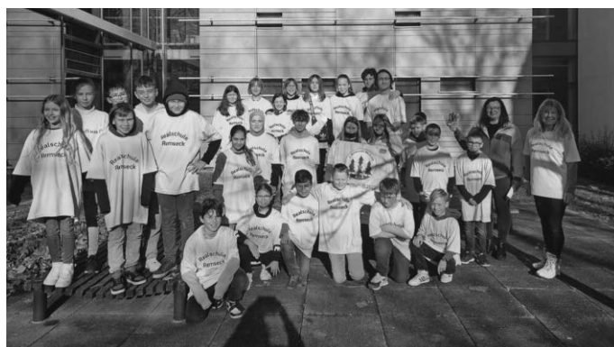
Ein Teil der Teilnehmer

Wir haben nicht nur sehr erfolgreich am Remsecker Waldlauf teilgenommen - wir haben auch die meisten Teilnehmer gestellt.