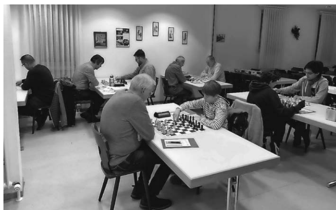
Volle Konzentration im Spielsaal

Herzlichen Glückwunsch an die Mannschaft und vor allem an den tollen Einsatz unserer Jugendlichen.