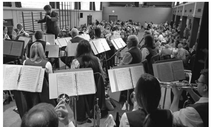
Das Große Blasorchester in Aktion.

Wir haben uns über alle Helfer gefreut, welche bei Auf- und Abbau, hinter der Theke und in der Küche gearbeitet haben. Herzlichen Dank euch allen! Ebenso den fleißigen Hobbybäckern und gut gelaunten Musikern!