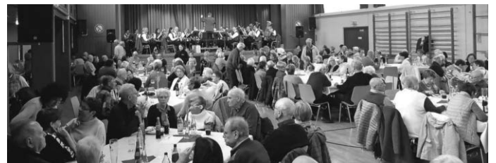
Frühschoppenkonzert im vollen Saal