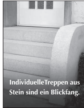
Individuelle Treppen aus Stein sind ein Blickfang.