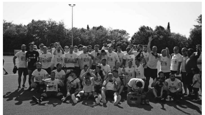
So sehen Sieger aus: Die erste und zweite Mannschaft des SV Pattonville feiern die Meisterschaft und den Aufstieg.