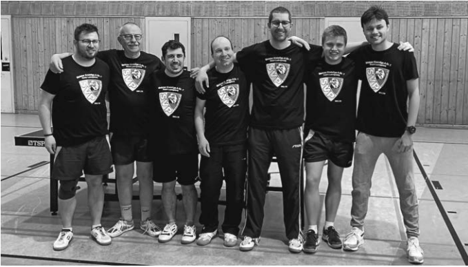
Meister der Tischtennis Kreisliga A