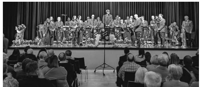
Auftritt des Großen Orchesters in der Stadthalle