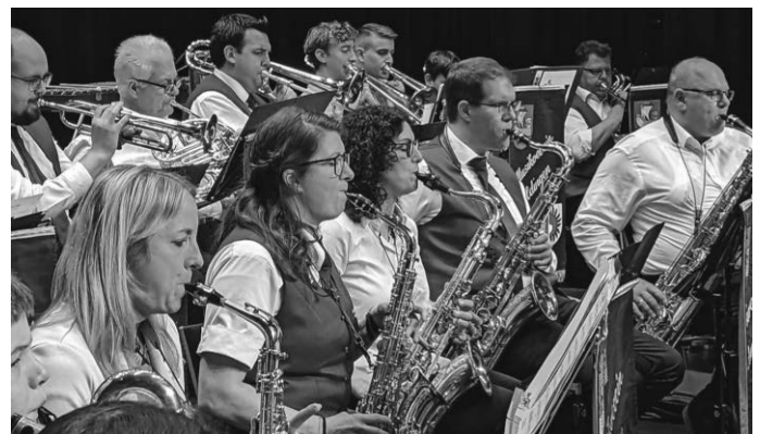
Ein Blick mitten ins Orchester