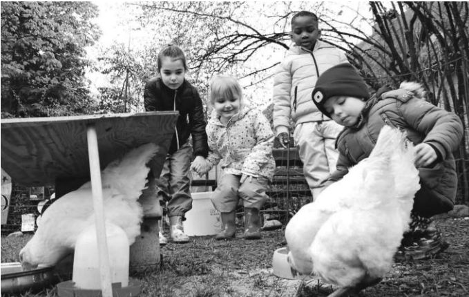
Die Kinder füttern die Hühner.