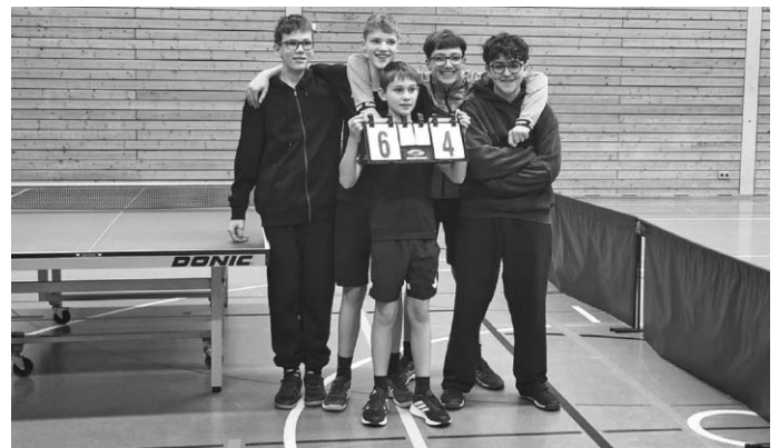
SV Pattonville U19 II

Insgesamt zeigte sich der SV Pattonville an diesem Wochenende in allen Mannschaften kämpferisch, geschlossen und leidenschaftlich – ein Heimspieltag, der den Zuschauern spannenden Tischtennis sport bot und die positive Entwicklung im Verein eindrucksvoll unterstrich.