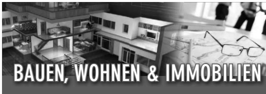
Ungerade KW*: in Pattonville