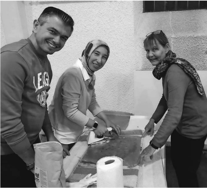
Bei der Herstellung von Bienenwachstüchern