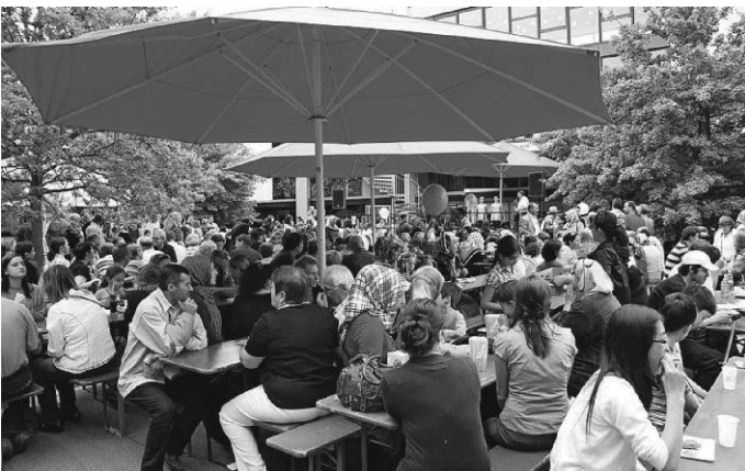
Nach zehn Jahren wird das Weststadtfest im Rahmen der Interkulturellen Woche sein Comeback feiern.

Am Samstag, 28. September 2024, feiert schließlich das Weststadtfest auf dem Hof der Eugen-Bolz-Schule sein Comeback. Zwischen 15:00 und 18:00 Uhr wird für Jung und Alt einiges geboten sein. Darüber hinaus finden im Laufe der Woche zahlreiche offene Angebote, beispielsweise im Bewohner- und Familienzentrum (BFZ), in der Begegnungsstätte Schafhof oder auch im Irish Pub The Landlord statt. Den Abschluss am Sonntag bildet das Bunte Treiben im Kulturkarree mit Straßentheater und Artistik auf dem Marktplatz zwischen 13:00 und 18:00 Uhr sowie das Interreligiöse Friedensgebet auf dem Bahnhofsvorplatz um 17:00 Uhr. Das gesamte Programm mit allen Infos zu den 21 Veranstaltungen finden die Kornwestheimerinnen und Kornwestheimer sowie alle Interessierten im Flyer sowie unter kornwestheim.de/ikw .