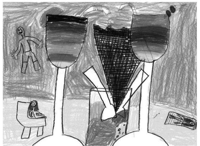
Sarah Kolitsas hat mit ihrem Bild den ersten Platz beim Malwettbewerb belegt.

Von Juli bis September sind unterschiedliche Veranstaltungen geplant. Bestandteil des Programms sind zum Beispiel eine Schnitzeljagd, kreative Angebote im Museum im Kleihues-Bau oder ein Radfahrtraining bei der Polizei. Entspannen können die Kinder und Jugendlichen in der Summer Lounge im Jugendzentrum, wo gegrillt wird und auch Cocktails schlürfen angesagt ist. Zur Auswahl stehen neben eintägigen Ausflügen auch mehrtägige Aktivitäten. Die Titelseite der Sommerferienbroschüre zeigt das Bild der Gewinnerin des diesjährigen Malwettbewerbs, der immer im Zuge der Neugestaltung der Broschüre alljährlich veranstaltet wird. Sarah Kolitsas hat mit ihrem Bild, das einen Besuch am Strand zeigt, den ersten Preis gewonnen. Die weiteren Preisträgerinnen und Preisträger sind Christian W., Sophie P., Jason Z. und Maxi S.. Die prämierten Bilder sind zum einen in der Broschüre zu finden, zum anderen werden sie während der Sommerferien in der Stadtbücherei im Kultur- und Kongresszentrum Das K ausgestellt. Das Programm steht online zur Verfügung und wird im Juli noch einmal aktualisiert. Interessierte sollten sich aber bereits jetzt anmelden, da die Programmpunkte erfahrungsgemäß schnell ausgebucht sind. Sollten sich Änderungen ergeben, werden die Teilnehmerinnen und Teilnehmer direkt informiert. Unter kornwestheim.de/sommerferienprogramm können die Angebote sowie die individuellen Anmeldungsmodalitäten nachgelesen werden.