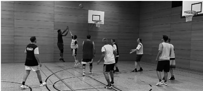
Kurzes Aufwärmen - und schon ist die Korbjagd eröffnet.