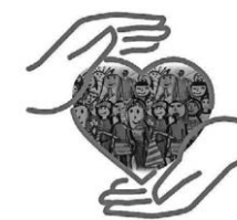
Förderverein der Grundschule Pattonville