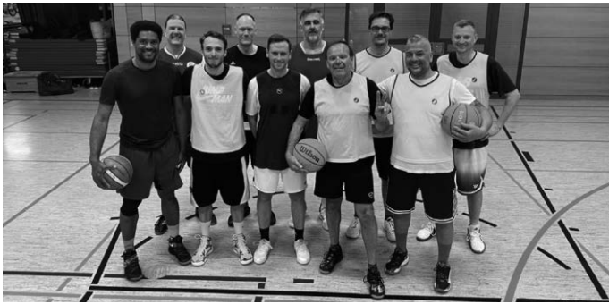
Ein starkes Team: die Freizeitgruppe Basketball.