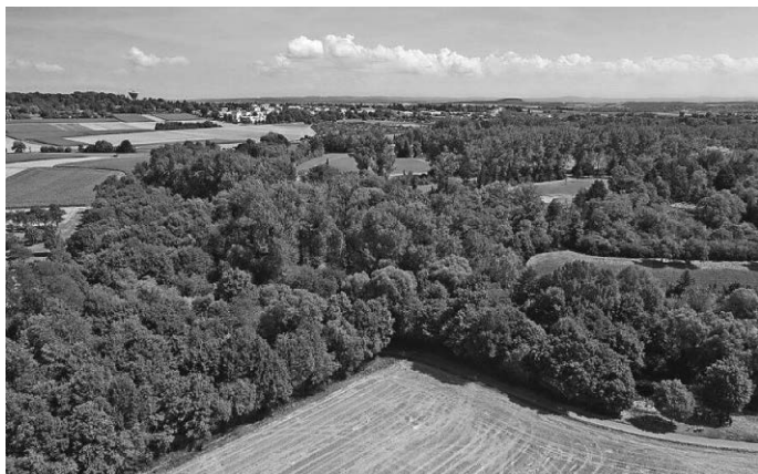
Die Stabsstelle Umwelt- und Klimaschutz der Stadt Kornwestheim sucht aktuell in einem Ideenwettbewerb einen Namen für den ersten Kommunalwald.

Für die Teilnahme gelten einige Spielregeln. Mitmachen darf jeder, der seinen Wohnsitz in Kornwestheim hat. Pro Person ist nur ein Vorschlag zulässig, es müssen neben dem eigenen Namen auch die Anschrift und das Datum angegeben werden. Selbstverständlich werden die Daten ausschließlich zur Teilnahme am Namenswettbewerb verwendet, um den/die Gewinner/-in zu kontaktieren. Darüber hinaus dürfen nur Einzelpersonen und keine Gruppen teilnehmen. Wird ein Name mehrfach eingereicht, entscheidet der Zeitpunkt der Einsendung. Die Namensvorschläge dürfen nicht gegen geltendes Urheber- oder Markenrecht verstoßen.