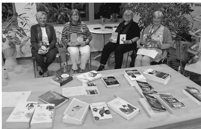
Das Büchereiteam stellt Lesenswertes vor

Erfreulich gut besucht wurde unsere Veranstaltung »Brezel und Buch« am vergangenen Mittwoch. 10 spannende, heitere und historische Romane wurden den 15 Teilnehmern vorgestellt. Dabei natürlich auch aktuelle Bestseller wie der 1300!! Seiten umfassende neue Thriller von Robin Galbraith »Das tiefschwarze Herz« oder Miss Bensons Reise von Rachel Joyce in der es um eine spannende Abenteuergeschichte um eine Käfersuche in Neukaledonien geht oder das Buch mit dem sperrigen Titel: »Junge Frau am Fenster stehend, Abendlicht, blaues Kleid« von Alena Schröder, das in zwei Strängen Gegenwart und Vergangenheit einer Familie verwebt. Natürlich auch einige Lieblingsromane der Mitarbeiterinnen, wie z.B. der Roman von Ewald Arenz: »Alte Sorten« und Dörte Hansens »«Zur See«. Alle Bücher können ab sofort in der Bücherei ausgeliehen werden.