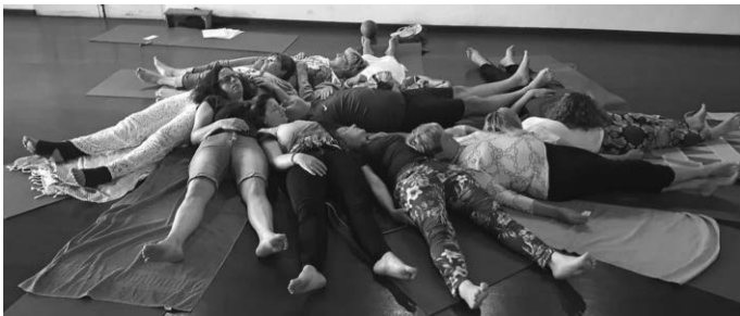
Entspannungsübungen: Auch das gehört zum Kurs »Rücken Fit« dazu.

Durch stabilisierende Übungen wird deine Rücken-, Bauch und Rumpfmuskulatur gezielt gestärkt. Zudem werden verkürzte Muskelgruppen durchs Dehnen beweglicher gemacht. Im Laufe des Kurses verändert sich deine körperliche und geistige Ausrichtung ganz allmählich während sich deine Schmerzen gleichzeitig lindern – ganz ohne Medikamente.