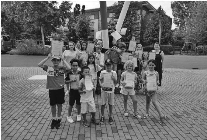
Alle Teilnehmer des Leseclubs mit ihren Urkunden