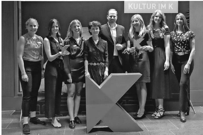
Das Team des K beim Abo-Fest

Der Ticketvorverkauf für die Theater- und Kindertheater-Abos ist bereits gestartet. Ab Dienstag, 2. August 2022, können auch Wahl-Abos und Einzeltickets erworben werden. Eintrittskarten für die Veranstaltungen sind an der Information im K sowie bei allen bekannten ReserviX-Vorverkaufsstellen und über die Homepage unter www.das-k.info erhältlich. Restkarten gibt es nach Verfügbarkeit am Veranstaltungstag im K.