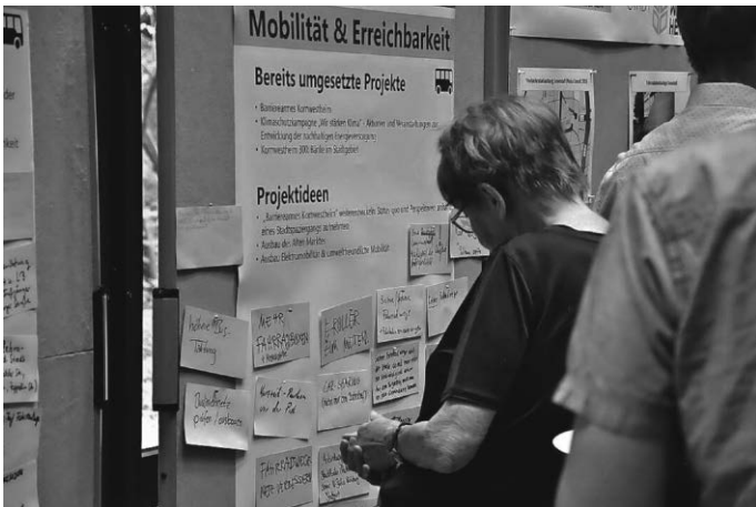
Die Pinnwände an den vier Thementischen füllten sich im Laufe des Abends rasch.