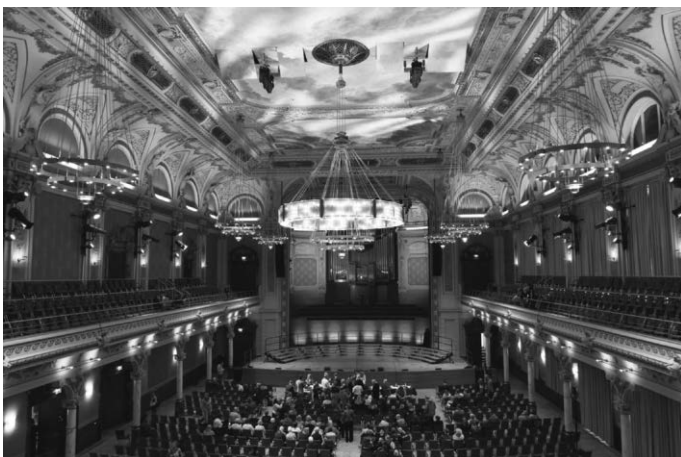
Historische Stadthalle Wuppertal

Mit einem erzielten Gesamtscore von 70,5 Punkten zeigten die Sängerinnen eine Gesamtdarbietung, die hör- und sichtbar gewachsen ist: Mehr Rhythmus, mehr Ausdruck – und stets ein Lächeln auf den Lippen. Ganz im Sinne der Wettbewerbsstücke „I Got Rhythm“ und „Smile“ vergaben manche Punktrichter sogar bis zu 73 Punkte. Das kann sich sehen lassen und hat die gesteckten Ziele des Chores sogar noch übertroffen – getreu dem Motto: #BetterThanYesterday