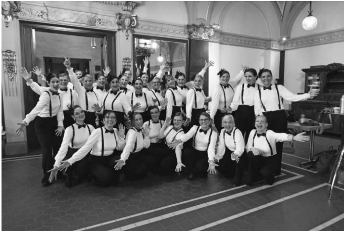
Ladies Auftrittsreif im Foyer

Wuppertal/Pattonville - Ein eindrucksvolles Wettbewerbswochenende beim internationalen Barbershop Music Festival 2026 in der historischen Stadthalle in Wuppertal liegt hinter den Ladies. Wer live oder online nicht dabei war, hat definitiv etwas verpasst. Auf (inter-)nationalem Parkett mit Chören aus Amerika, Kanada, Großbritannien und natürlich vielen Chören aus Deutschland stellten die Damen sich einer anspruchsvollen Konkurrenz – und überzeugten.