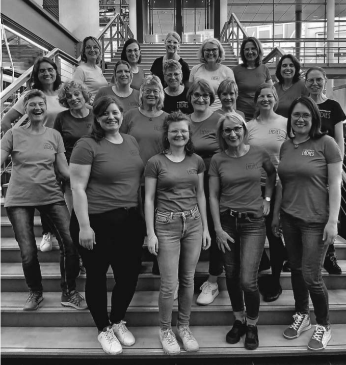
Die A-Cappella Ladies im Konzerthaus Dortmund vor dem großen Auftritt bei der Deutschen Meisterschaften der Babershopchöre.

Das Schönste an den Tagen in Dortmund war das Wiedersehen mit all den anderen Barbershopbegeisterten aus Deutschland, den USA, den Niederlanden und wo sie alle herkommen. Freude bereitete das gemeinsame singen von Tags (im Barbershopgesang das Ende eines Stückes) und Liedern im Afterglow (Musikalisches Nachglühen). Das Motto des Festivals A Cappella Love war über all zu spüren. (jb)