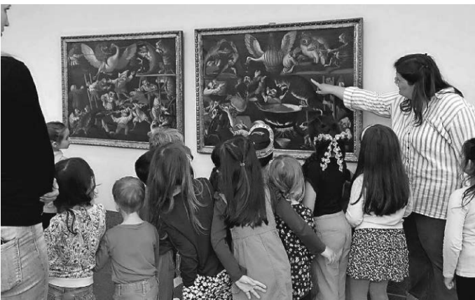
In den Bann der Kunst wurden zuletzt zahlreiche Kinder im Museum im Kleihues-Bau gezogen.

Volles Haus im Kleihues-Bau: Am Kinder-Kunst-Tag, 9. Mai 2023, waren die Kinder aus dem städtischen Rathaus-Kindergarten sowie aus dem Ludwigsburger Knaxgarten zu Gast und durften das Museum erkunden.