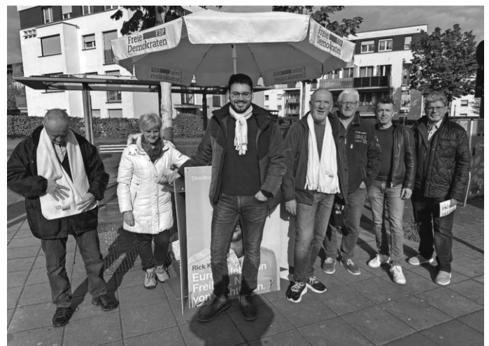
Bild vom Infostand 2024